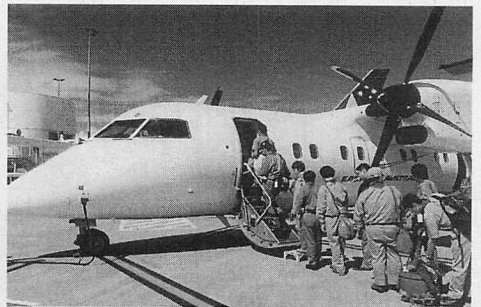
▲シドニー空港からキャンベラへ向かう36名乗りのプロペラ機。