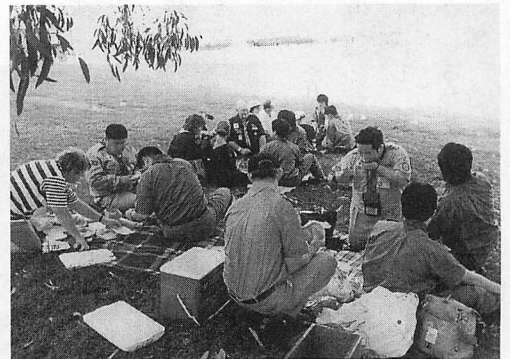
◀グリフィン湖畔。ホームステイ家庭とランチタイム。

今回の派遣はいろいろと迷惑をかけてしまいました。またこのような機会がありましたら、ぜひ参加したいと思います。最後に、この派遣に参加したメンバーの皆さん、いろいろと教えていただきありがとうございます。またいつか会える日を楽しみにしています。